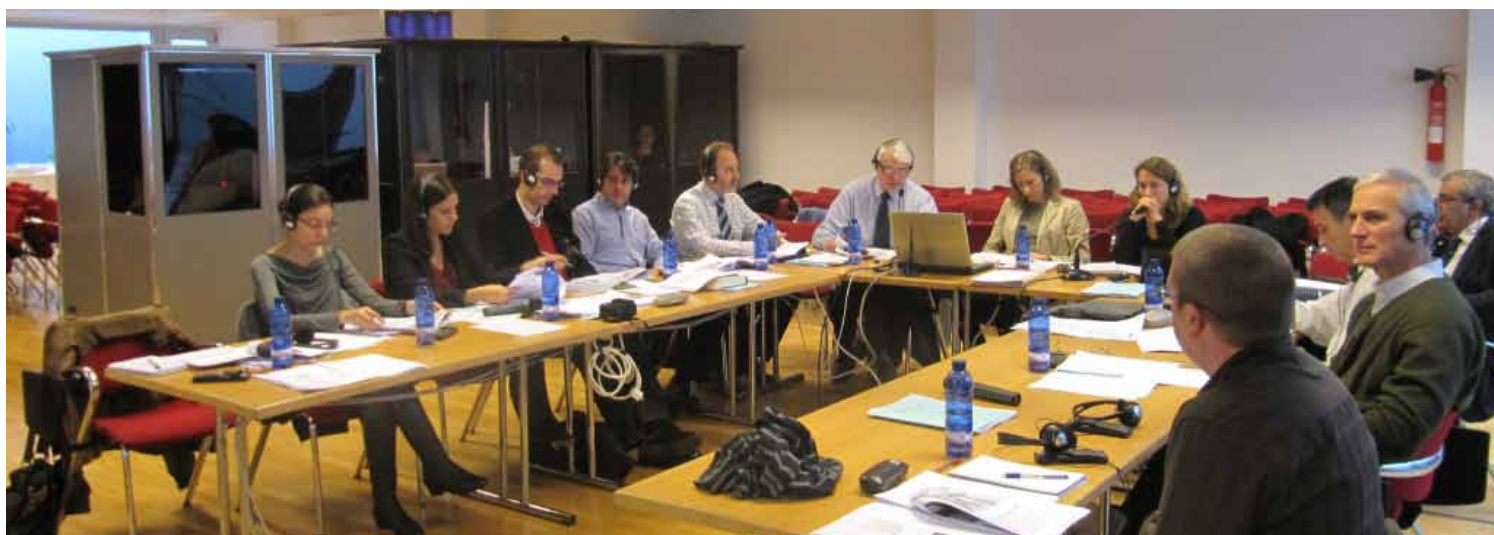
Reunión del grupo de trabajo del WP6 celebrada en A Coruña

Más información en: http://ancorim.aquitaine.fr/