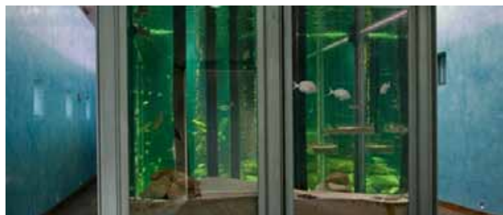
Acuario del Museo do Mar de Galicia

Emplazado en la Ría de Vigo (Pontevedra), en la vieja fábrica de conservas Alcobre-Molino de Viento (1987), el Museo ocupa 14.000 m 2 que el arquitecto César Portela, encargado de su diseño, definió como "... una constelación de sitios que hace posible que cada visitante pueda encontrar el «suyo» propio (...)"