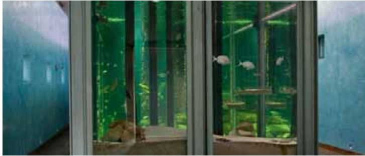
Acuario del Museo do Mar de Galicia

Emplazado en la Ría de Vigo (Pontevedra), en la vieja fábrica de conservas Alcobre-Molino de Viento (1987), el Museo ocupa 14.000 m 2 que el arquitecto César Portela, encargado de su diseño, definió como "... una constelación de sitios que hace posible que cada visitante pueda encontrar el «suyo» propio (...)".