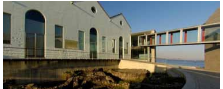
Vista del Museo do Mar

Importante también es la iniciativa del Museo do Mar en el desarrollo de algunos proyectos como "A Memoria do Mar", que ha supuesto la digitalización de fondos fotográficos familiares relacionados con el mar para la reconstrucción de nuestro pasado histórico a través de las imágenes de la costa y sus gentes, y al que puede accederse vía web. Otro de sus proyectos es el proyecto Neuston, que pretende suscitar un diálogo entre investigadores científicos y creadores artísticos y literarios. También es importante el apoyo que el Museo da a la organización de los Encuentros bienales de Embarcaciones Tradicionales de Galicia, encargándose de organizar la faceta cultural en tierra.