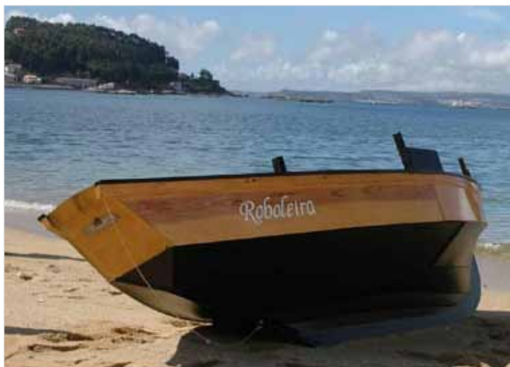
Dorna Polbeira, embarcación tradicional de Galicia

“Dorna, la que podemos llamar embarcación inteligente”, así titula Staffan Mörling el artículo que ha escrito para el Catálogo de embarcaciones y astilleros tradicionales del proyecto DORNA. Con este artículo el Catálogo ha tenido el privilegio de contar con la participación de una de las figuras claves de la recuperación y puesta en valor del patrimonio marítimo de la costa gallega. Staffan Mörling nació en Suecia y se licenció en Latín e Historia del Arte, especializándose más tarde en Antropología Cultural. En el año 1964 Mörling llegó a las Islas Feroe para investigar la cultura tradicional escandinava, y un poco más tarde a la Isla de Ons (Pontevedra), con la intención de hacer lo mismo con respecto a la cultura tradicional atlántica española. Fue en Ons donde se despertó su inquietud por el estudio de las embarcaciones tradicionales y la vida de las gentes de la costa.