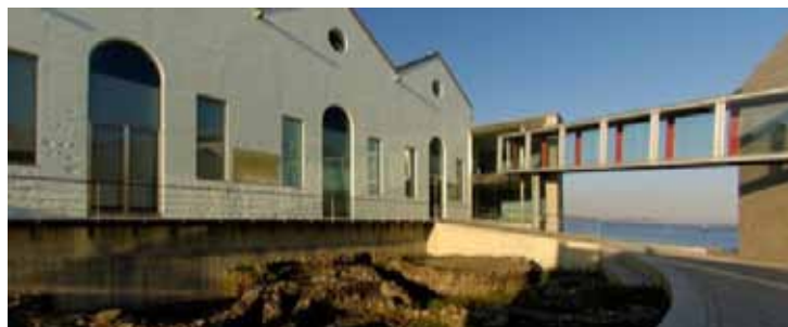
Vista del Museo do Mar

Importante también es la iniciativa del Museo do Mar en el desarrollo de algunos proyectos como "A Memoria do Mar", que ha supuesto la digitalización de fondos fotográficos familiares relacionados con el mar para la reconstrucción de nuestro pasado histórico a través de las imágenes de la costa y sus gentes, y al que puede accederse vía web. Otro de sus proyectos es el proyecto Neuston, que pretende suscitar un diálogo entre investigadores científicos y creadores artísticos y literarios. También es importante el apoyo que el Museo da a la organización de los Encuentros bienales de Embarcaciones Tradicionales de Galicia, encargándose de organizar la faceta cultural en tierra.