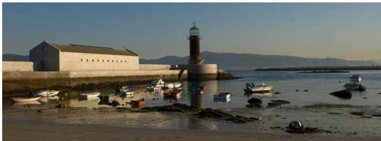
Entorno del Museo do Mar de Galicia

Para conocer más sobre el Museo do Mar de Galicia visita: http://www.museodomar.com/es